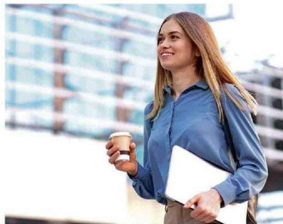
Cómo enfrentar el regreso al trabajo y a la rutina tras el periodo de vacaciones será el tema del primer conversatorio impulsado por Mutual de Seguridad.

El primer encuentro de la temporada se realizará el 25 de febrero bajo el título "Retorno Laboral: Cómo enfrentar marzo sin descuidar la salud mental y el bienestar", que –al igual que en 2024– podrá verse en SoyTV y en SoyChile.cl, con una amplia difusión de Arica a Chiloé.