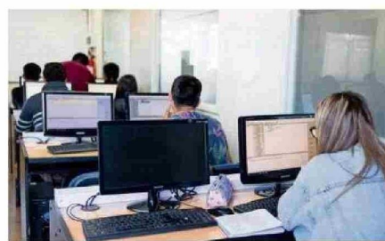
LA SES SE COMPROMETE A RESGUARDAR LOS DERECHOS DEL ESTUDIANTADO.

En el corto plazo, el CFT Teodoro Wickel debe reanudar sus actividades regulares pre-