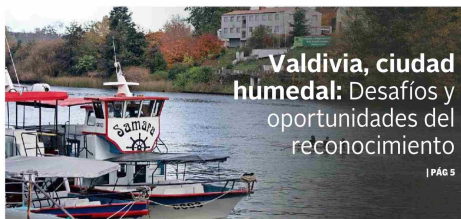
Valdivia, ciudad húmeda: Desafíos y oportunidades del reconocimiento