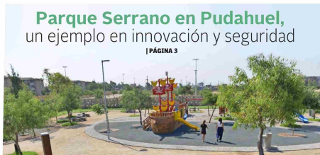
Parque Serrano en Pudahuel, un ejemplo en innovación y seguridad