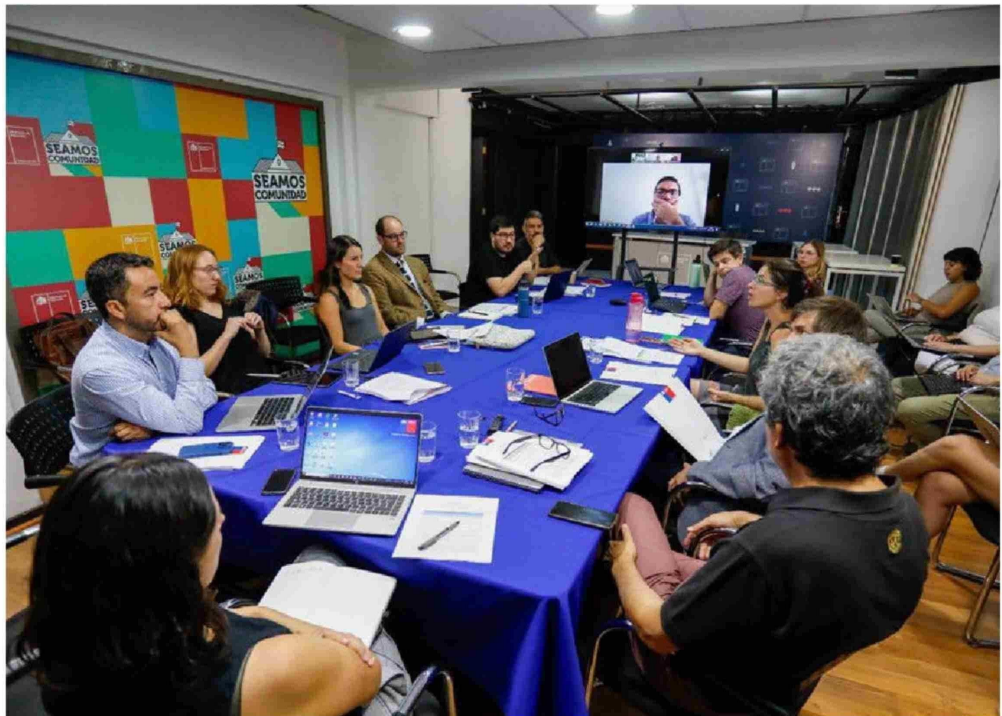
► En la última semana de enero se realizó la séptima sesión de la mesa técnica que busca mejorar el Sistema de Admisión Escolar.

"Por una parte, se reconoce al SAE como un sistema de asignación que ha contribui-