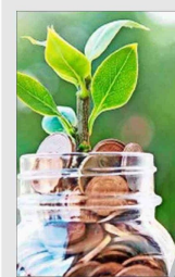
Arauco presentó por primera vez sus avances en la medición del Capital Natural de sus activos biológicos, que cuantifica el impacto y los aportes de la compañía sobre los ecosistemas.

Con el fin de reafirmar el compromiso que tiene Arauco con la sustentabilidad, la empresa logró la emisión de 10 millones de UF, en Chile, en bonos sustentables. Entre los proyectos que sustentan el financiamiento se encuentran algunos relacionados al uso sostenible de la tierra y gestión forestal, programas de gestión de agua, emisiones, residuos y el acceso a servicios básicos.