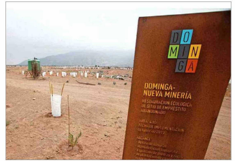
Es tercera vez que un Comité de Ministros se pronunciará sobre el proyecto minero-portuario Dominga.

En este sentido, quien debiese asistir a la reunión por parte de la cartera de Salud es la subsecretaria de Salud Pública, An-