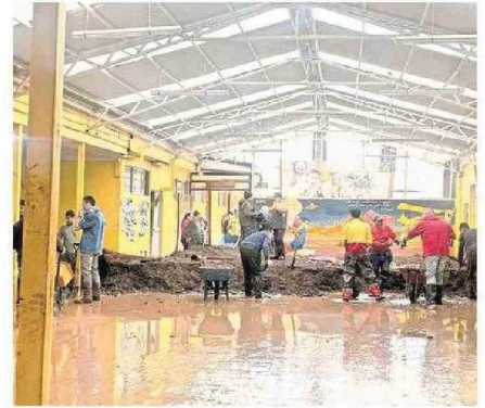
CECIDA LICEO POLITÉCNICO DE CURANILAHUE TAMBIÉN QUEDÓ BAJO EL AGUA.

Colegio de Profesores mostró su preocupación por las condiciones en que se producirá el regreso de vacaciones de invierno. Mineduc comprometió apoyo.