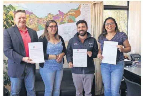
Este martes Penco celebró la declaratoria del Humedal Cementerio.

Estas zonas se suman al último humedal declarado en 2024, en la comuna de Penco. Permitirán un mayor resguardo ante inundaciones.