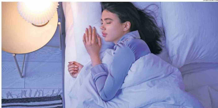
LA CIENCIA CONFIRMÓ EL EFECTO REPARADOR QUE TIENE UN SUEÑO PROFUNDO.

Aunque los ratones tratados con zolpidem se dormían más rápido, el transporte de fluidos al cerebro