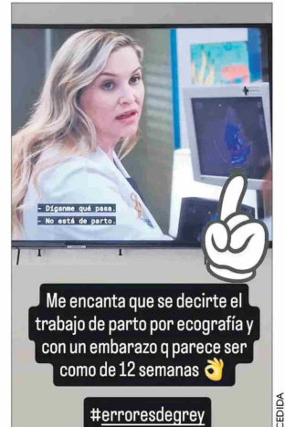
La ecografía ni el uso que se le da son correctos aquí.

usar ecografías con fetos que no corresponden al tamaño que se indica de gestación, "en la serie generalmente diagnostican trabajos de parto por este examen y ese es un error garrafal. El trabajo de parto se diagnostica mediante un tacto vaginal, no hay otra manera".