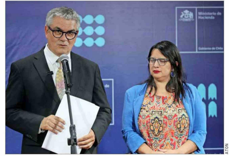
El ministro de Hacienda, Mario Marcel, y la directora de Presupuestos, Javiera Martínez, comentaron durante 40 minutos los trasposos desde Corfo.

El ministro de Hacienda señaló que los recursos solicitados en 2023 a la entidad fueron necesarios porque hubo otros ingresos "que estuvieron por debajo de lo presupuestado".