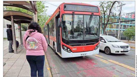
ALZA. — El pasaje en el transporte público metropolitano ha experimentado un aumento de $40 este año.

investigador en transportes, observa con recelo los porcentajes de evasión compartidos por el Ministerio de Transportes: “Me parece muy dudoso, cuando menos no se puede comparar con las cifras anteriores por el tamaño de la muestra (...). Tengo la sensación de que las cifras de evasión que muestra el Gobierno no son las reales”.