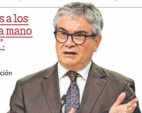
MARIO MARCEL Ministro de Hacienda habló sobre la remoción del jefe del SEA nortino que rechazó millonario proyecto de Colbún en Taital.

"A veces hay funcionarios a los que se les pasa un poco la mano en estos procedimientos".