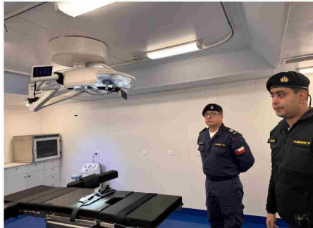
Quirófano del área de Sanidad Naval, completamente equipado.