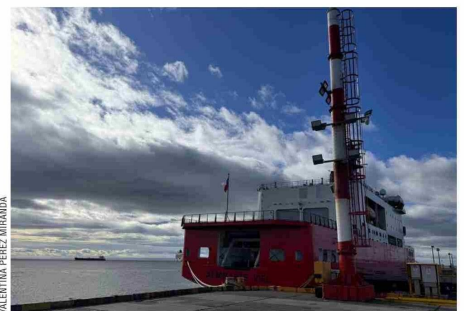
El buque científico antártico más grande construido en el país y Sudamérica.

El rompehielos también cuenta con una completa unidad de Sanidad Naval, liderada por el capitán de corbeta Camilo Lamilla. "Podemos atender emergencias básicas y estabilizar pacientes en caso de accidentes. Incluso, si fuese necesario, podríamos realizar cirugías de emergen-