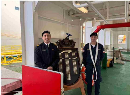
A la entrada del gran rompehielos la tripulación está contenta de poder ser parte de este hito.