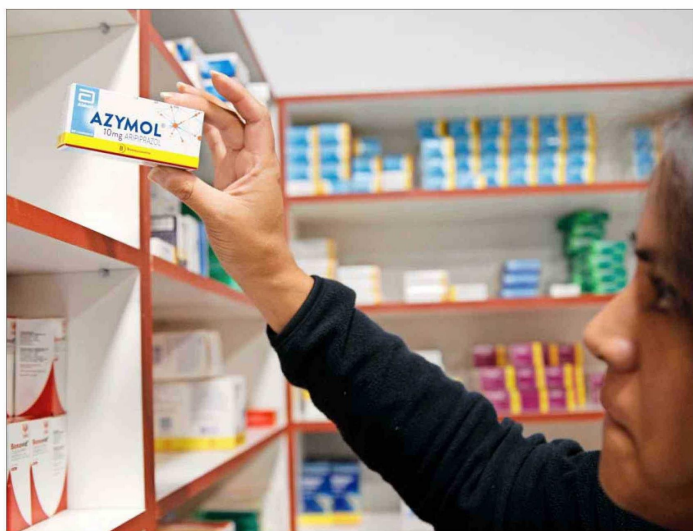
Para los expertos, un gasto importante está vinculado con el costo de los medicamentos, aunque la brecha es amplia según el tipo de aseguramiento de las personas.

ca en que "las coberturas de aseguramiento en relación al gasto promedio hospitalario también han ido disminuyendo y, por lo tanto, eso también incide directamente en el gasto de bolsillo".