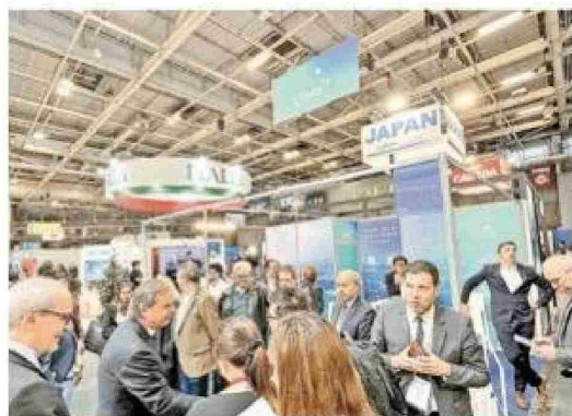
Un aspecto del stand que tuvo Chile en la versión del año pasado de esta feria.

Hyvolution Paris es el principal evento global de hidrógeno verde, reconocido por reunir a profesionales del sector, expertos, empresas y gobiernos. En su edición de 2025, contará con más de 300 expositores y 130 workshops, ofreciendo una plataforma para explorar las últimas innovaciones tecnológicas y oportu-