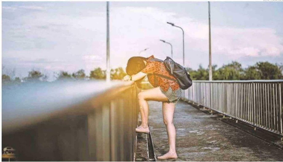
LA ORGANIZACIÓN MUNDIAL DE LA SALUD (OMS) ASEGURA QUE EL SUICIDIO ES UN PROBLEMA DE SALUD PÚBLICA A NIVEL GLOBAL.