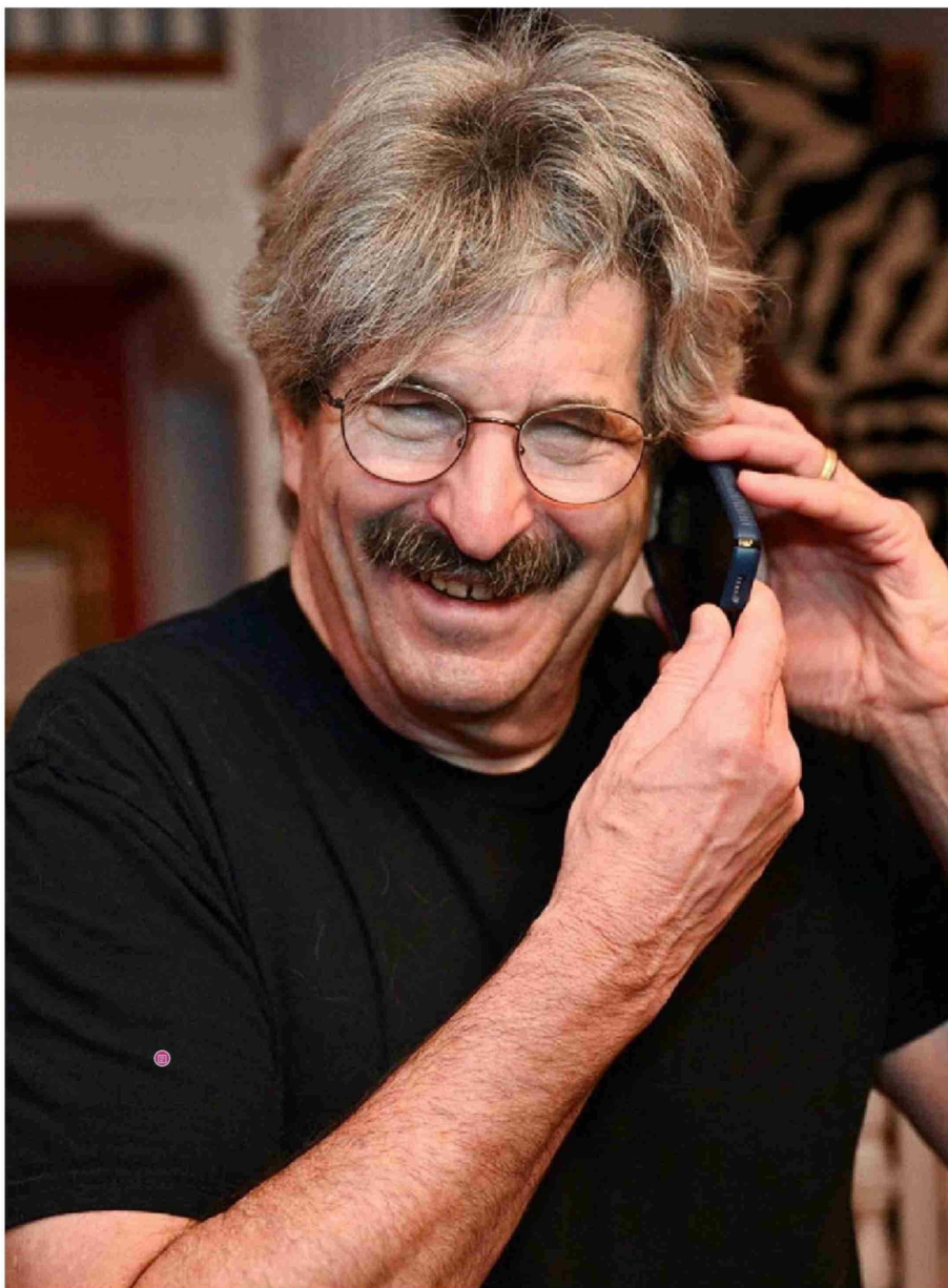
► Los científicos estadounidenses Victor Ambros y Gary Ruvkun (en la imagen) recibieron el Premio Nobel de Medicina

Esto se denomina regulación genética y es muy importante porque ayuda a las células a decidir qué tipo de célula deberían ser. También tienen muchas funciones en enfermedades difíciles de tratar, como el cáncer y enfermedades neurológicas como el Alzheimer y el Parkinson.