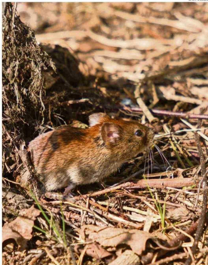
EL OLIGORYZOMYS LONGICAUDATUS ES EL ROEDOR PORTADOR DEL VIRUS ANDES.

Los nanoanticuerpos se consideran una versión simplificada de los anticuerpos convencionales y tienen la capacidad de neutralizar un