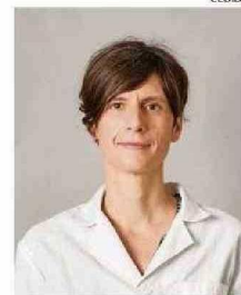
TISCHLER ES BIOTECNÓLOGA.

En esa línea, Tischler comenta que “nos enfocamos en generar un abanico de anticuerpos altamente específicos para el virus Andes, porque sabemos que