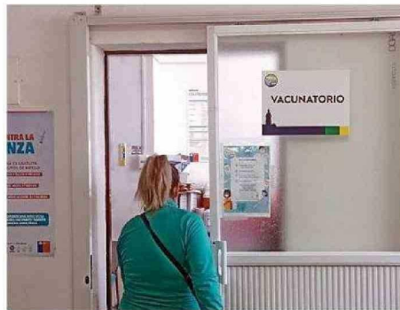
MANTENER CALENDARIO DE VACUNACIÓN PARA COVID ES CLAVE.

En tanto, desde la Seremi de Salud de la Región de