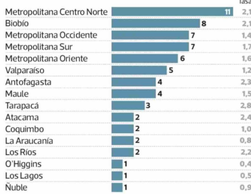
Homicidios de NNA por zona