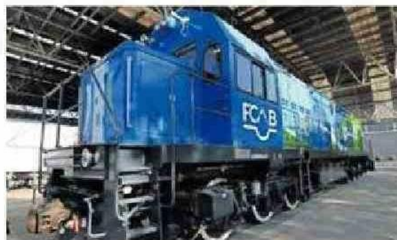
FCAB BUSCA SU OPTIMIZACIÓN TECNOLÓGICA.