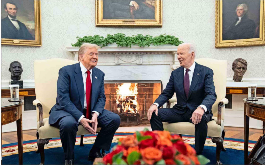
TRUMP Y BIDEN se reunieron ayer en la Casa Blanca por primera vez desde el debate presidencial que terminó en la renuncia del demócrata a la campaña.

“Creo que es una buena señal, pero no sé cuánto significa más allá de que se están reuniendo y hablando. Esta vez, Biden está perdiendo, y ha apostado la reputación de su partido a ser más partidario de las normas y tradiciones democráticas, por lo que