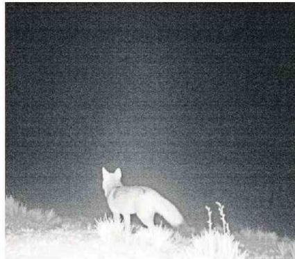
UN ZORRO CULPEO.