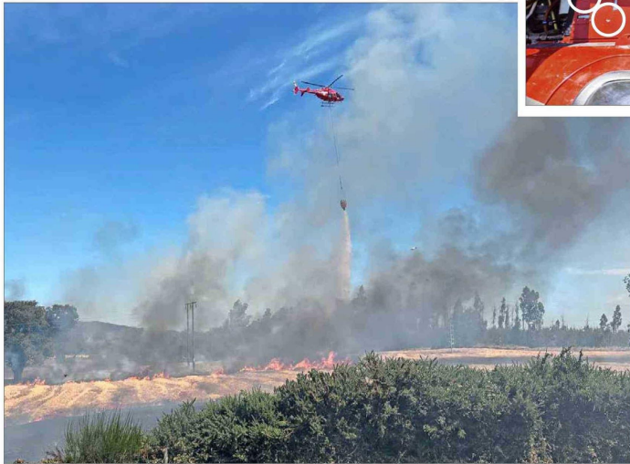
AERONAVE. — El helicóptero había estado combatiendo los incendios de forma permanente, hasta el ataque recibido ayer. Se indaga la autoría del ataque.

Mientras efectuaba labores de auxilio, el piloto sintió los impactos en el fuselaje y debió descender para ponerse a salvo. El Gobierno sostuvo que “eventos de estas características son inaceptables”.