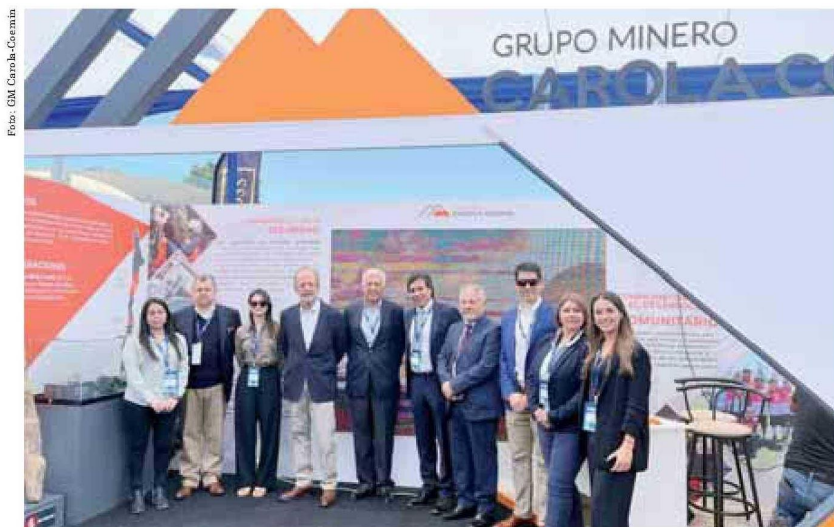
En el marco de Forede, el Grupo Minero Carola-Coemin fue distinguido por Corproa en las categorías de "Seguridad y Salud Ocupacional" y "Sustentabilidad".