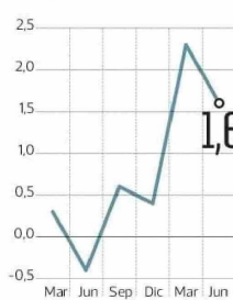
PIB Trimestral Var % Anual