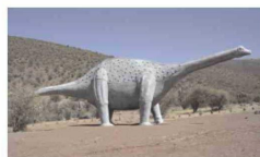
Réplica de titanosaurio, en el Monumento Natural de Pichasca.

El cráneo era corto y aplanado en el frente , con las cuencas de los ojos ubicadas atrás y las fosas nasales arriba, entre los ojos.