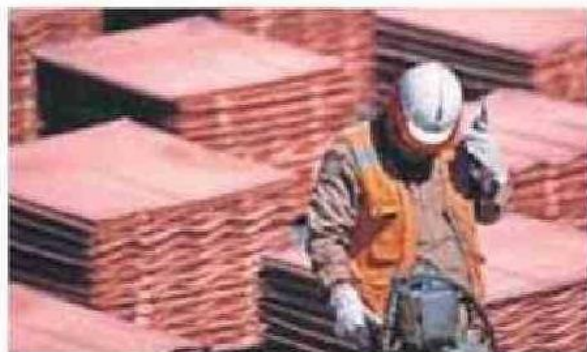
LA LIBRA DE COBRE CERRÓ AYER EN US$4,428.