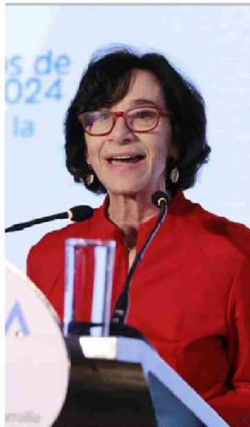
Rosanna Costa, presidenta del Banco Central.

El ministro agregó que "el congelamiento de las tarifas eléctricas fue particularmente