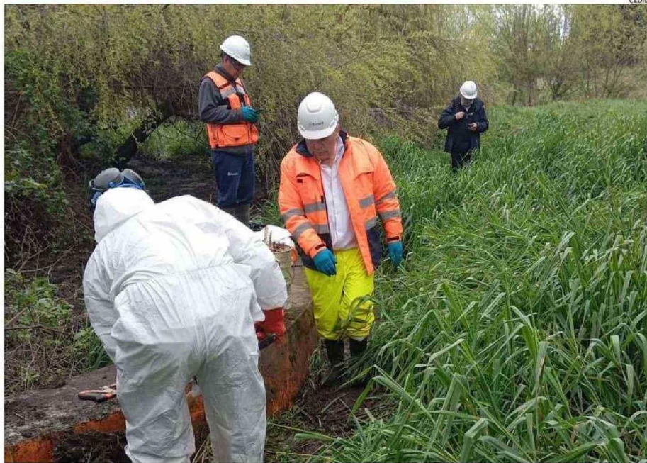
ESTE LUNES, FISCALIZADORES DE LA SISS COMPROBARON EL DERRAME Y RECOGIERON ANTECEDENTES QUE SE SUMAN A LA INVESTIGACIÓN EN CURSO.

“Allí hay dos cámaras de alcantarillado, una que queda al costado oeste, donde ya rebasó en agosto, pero esta vez la contaminación rebasó por la cámara de alcantarillado que está al lado este, yendo hacia Francke. Acceder a ese sistema de cámaras no es fácil; hay que cruzar el río y ahora obviamente tiene un caudal importante; y si se entra por el lado de Francke, está lleno de vegetación y matorrales. La empresa