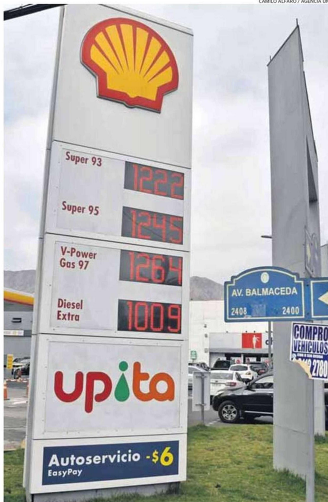
ECONOMISTAS COINCIDEN EN QUE EL MPECO FRENÓ EL ALZA DE PRECIOS EN COMBUSTIBLES.

En esto coincide Ortiz: "El gobierno ha tomado la decisión correcta en cuanto a garantizar la operación del Mepco, incrementando el tope máximo de subsidio del sistema hasta los US$3.000 Millones". Acota que "es necesario tener en cuenta que Chile importa cerca del 97% del petróleo que consume. Por lo tanto, es un