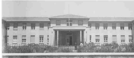
Frontis años '50 Hospital de La Serena Avenida Balmaceda 916

El Hospital de La Serena es el primer recinto de Chile construido en regiones y su edificio actual data de 1948. El centro asistencial logrará ser normalizado a través de dos importantes proyectos: El Centro de Diagnóstico Terapéutico (CDT) , el primero de la Región de Coquimbo y el más grande y moderno a nivel nacional, dispositivo que se encuentra actualmente operativo y, la construcción del nuevo Hospital de La Serena , que entregará también respuesta en el área quirúrgica y de hospitalización.