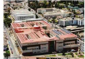
CDT (Centro Diagnóstico Terapéutico) Avenida Larraín Alcalde 1085