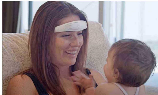
Los nuevos dispositivos de neuromodulación (en la foto) se usan tanto para tratar como para prevenir la migraña. En Chile ya hay uno disponible.