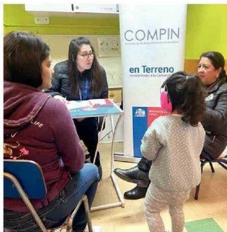
SE EVALUÓ EL GRADO DE DISCAPACIDAD DE LOS NIÑOS.

"A partir de esta resolución de discapacidad emitida por Compin, las