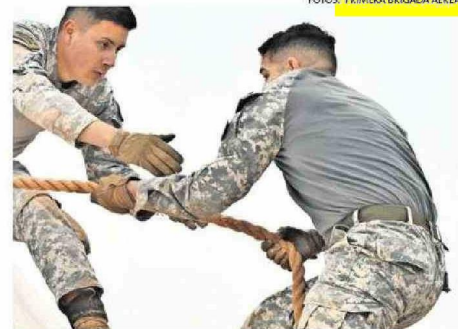
DESTACÓ EN TODO MOMENTO EL TRABAJO EN EQUIPO.