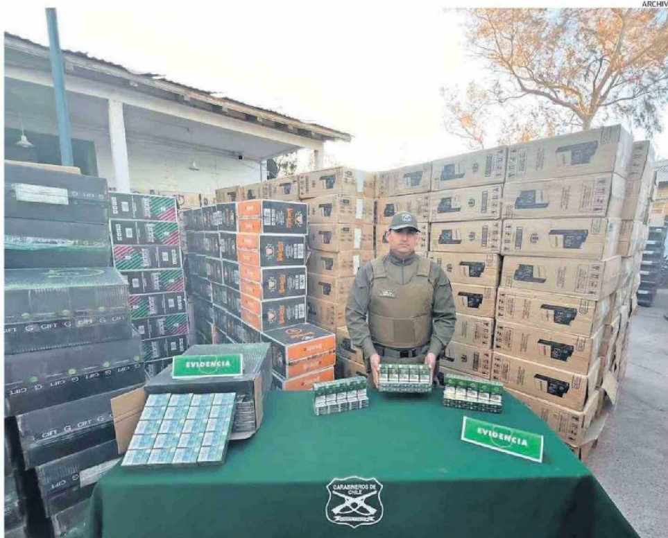
CARABINEROS BUSCA MEJORAR TRABAJO AL CRIMEN ORGANIZADO QUE INTERNA PRODUCTOS DE CONTRABANDO Y DROGAS AL PAÍS.