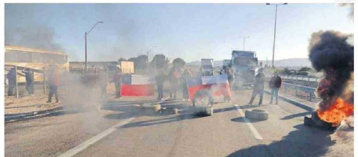
LOS PESCADORES ASEGURARON QUE PODRÍAN VOLVER A TOMARSE LOS CAMINOS.

Quizá a la Asamblea General de 2030, desde Atacama vaya una delegación de científicos que pudieran cumplir su anhelo de formación e investigación astronómica íntegramente en la región.