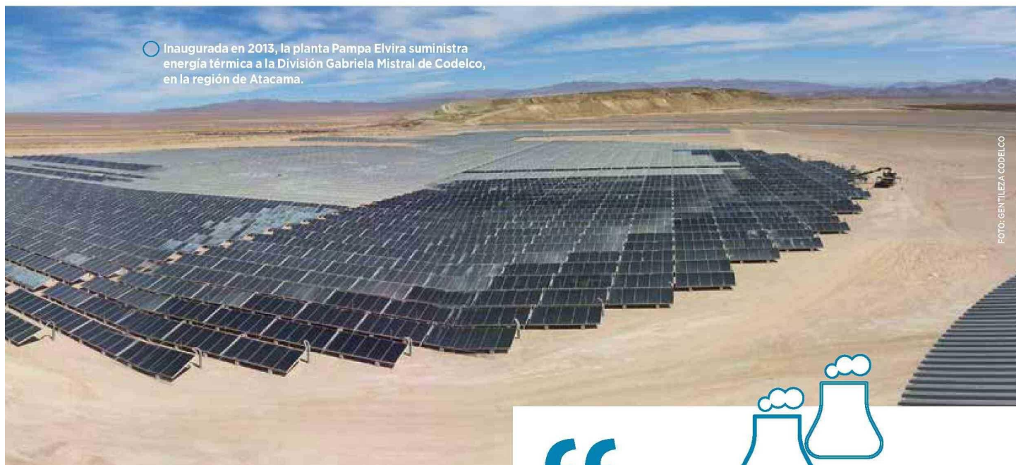
○ Inaugurada en 2013, la planta Pampa Elvira suministra energía térmica a la División Gabriela Mistral de Codelco, en la región de Atacama.