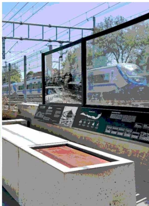
Más que una banca, este volumen permite que los niños se apoyen para trabajar con sus profesores.

precio del terreno, considerando que se trataba de 120 hectáreas. Hoy en ese terreno hay distintas tipologías inmobiliarias; y el paso de los años no solo va dañando los pocos remanentes que quedan de la maestranza, sino también contribuye a olvidar el polo de desarrollo que significó esta industria para la ciudad. Solo hay que considerar que la población sanbernardina aumentó en un 54% durante la década de 1920. También hay datos de las locomotoras que se fabricaron, como la Juan Antonio Ríos, hecha íntegramente in situ en 1942.