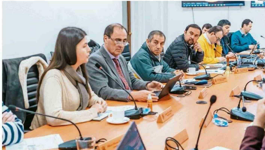
RESPECTO DE LA BAJA EJECUCIÓN, DESDE EL GORE DESTACARON FACTORES COMO LA LEY DE PRESUPUESTOS.

ce en la ejecución presupuestaria del Gore con el mismo rango de tiempo pero del año pasado, también se encuentra bajo, dado que a fines de junio del 2023, el porcentaje era del 33,8% y hoy es de un 26,2%.