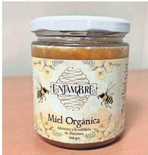
EN "ENJAMBRE" EL PROYECTO ESTÁ ORIENTADO A LA POLINIZACIÓN Y EXPORTACIÓN DE ABEJAS REINAS.