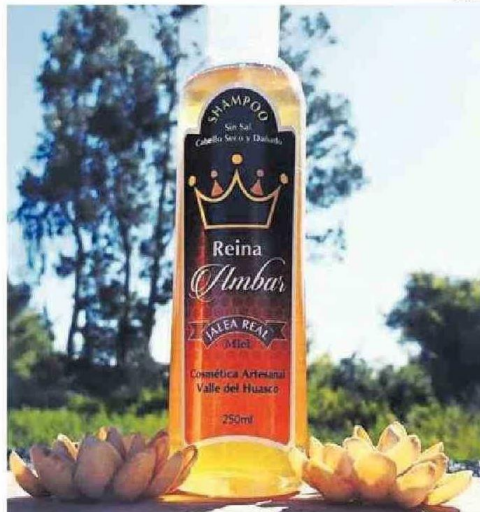
EN "REINA AMBAR", TRABAJAN CON MIEL NATURAL Y SUBPRODUCTOS DERIVADOS COMO HIDROMIEL, LICOR Y DESTILADO DE MIEL.

“Destacamos el trabajo asociativo que están realizando actualmente los productores de miel, ya que han logrado avances significativos”