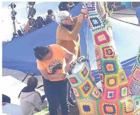
SE ADOBNARON LOS ÁRBOLES DE LA PLAZA CARLOS CONDELL