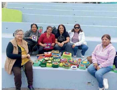
MUJERES TOCOPILLANAS EN INTERVENCIÓN EN LA PLAZA CONDELL

El objetivo de esta organización es visibilizar el borde costero, el esfuerzo de sus mujeres y proyectar la artesanía local como una expresión que ponga en relevancia el arte femenino construido en las ca-