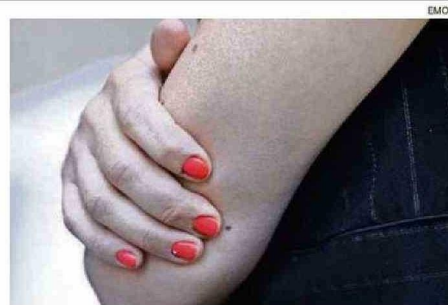
ESTE PRIMER ENCUENTRO ORIENTADO A LA ELIMINACIÓN DE LA VIOLENCIA SE EFECTURÁ MAÑANA EN LA SEDE DEL COLMED DESDE LAS 11 HORAS.