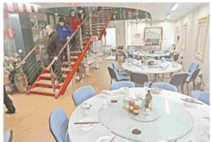
La Base Gran Muralla China por dentro.