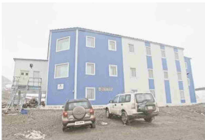
La actual Base Gran Muralla China.

Cuatro años después, Guo dirigió otra expedición a la Antártica, con la misión de establecer la segunda base de China. El equipo partió de Qingdao en noviembre de 1988 en el bar-