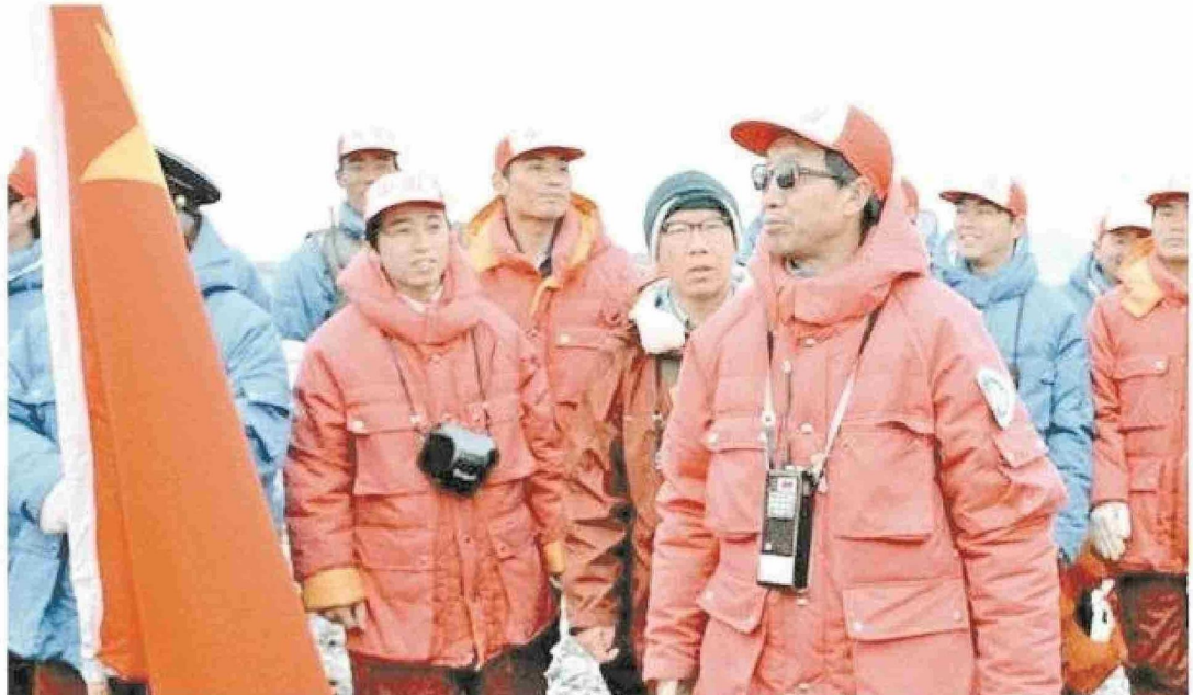
En febrero de 1985 se inauguró la primera Base China.