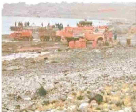
Primera Base China Gran Muralla, en proceso de construcción en 1985.