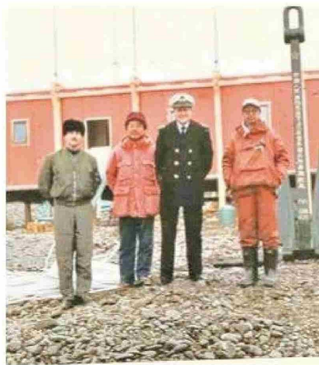
Visita profesional de los oficiales del buque Piloto Pardo, a la Base Gran Muralla, en 1985.

co Jidi. Después de llegar a la bahía Prydz en la Antártida, el barco se topó con una gran cascada de hielo en la noche del 14 de enero de 1989.