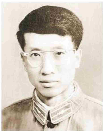
Gou Kun, el pionero de China en la Antártica.