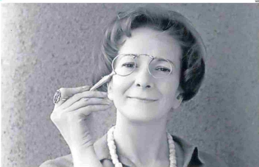
LA AUTORA RECIBIÓ EL PREMIO NOBEL DE LITERATURA EN 1996.

A remitentes con nombre y apellido aparecen respuestas como "lo que vamos a decir a continuación suena muy desmoralizador: es usted una persona demasiado franca y cándida para escribir bien. En las entrañas de un escritor con talento se arremolinan los más diversos demonios. E incluso si antes o después de escribir se encuentran adormecidos (o deberían encontrarse adormecidos), durante la escritura tienen una frenética actividad. Sin su ayuda, el escritor no podría adentrarse en las complicadas vivencias de sus personajes. Nada humano me es ajeno: ¡oh, esta sentencia no se puede aplicar a las vidas de los santos bondadosos!