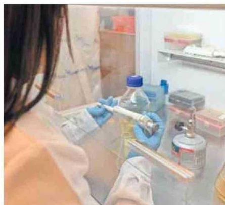
LITIO Y COBALTO SON FUNDAMENTALES PARA TECNOLOGÍAS ACTUALES.

ESTUDIO. Equipo multidisciplinario está aprovechando las capacidades únicas de estos microbios para abordar un desafío crítico: el reciclaje sostenible de baterías de ion-litio.