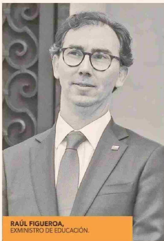
RAÚL FIGUEROA, EXMINISTRO DE EDUCACIÓN.