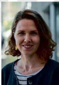
Encargada de Asuntos Económicos y jefa subrogante del Swiss Business Hub de la Embajada de Suiza en Chile