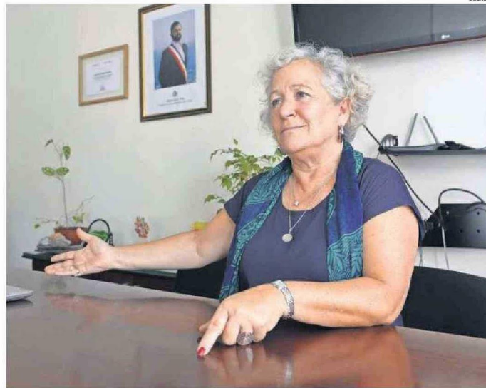
LA DIRECTORA DE SALUD CONFIRMÓ EL PRESUPUESTO BASE PARA EL HOSPITAL REGIONAL.